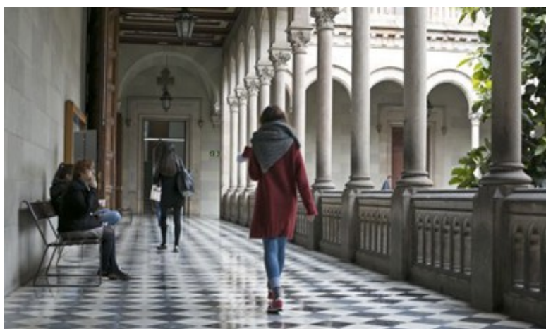
Историческое здание Барселонского университета

Чтобы посмотреть карту проведения мероприятия, нажмите здесь .